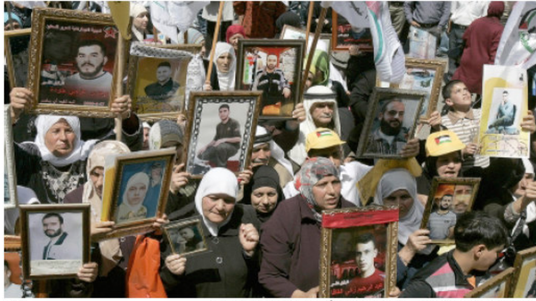
المثاث من المواطنين يشاركون في مسيرة جماهيرية في نابلس، اسس، تضامناً مع الأسرى في سجون الاحتلال الإسرائيلي

In addition to the lead headline in Al Ayyam about these two people's executions, the newspaper also printed a five-column picture of citizens participating in March in Nablus in solidarity with prisoners in Israeli prisons. This was confusing between the main headline and then the picture of the prisoners' families because the newspaper gave precedence to the execution of two people charged with collaboration over popular marches calling for the release of prisoners.