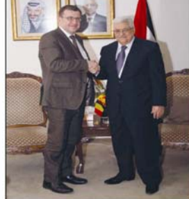
الرئيس اثناء استقباله نائب رئيس الوزراء البلجيكي.

لقضاء المصرى يصدر الشهر المقبل قراره بشأن اسقاط الجنسية عن المتزوجين من اسرائيليات